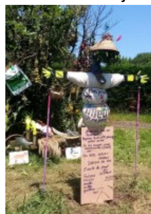
Deuxième : Jojo